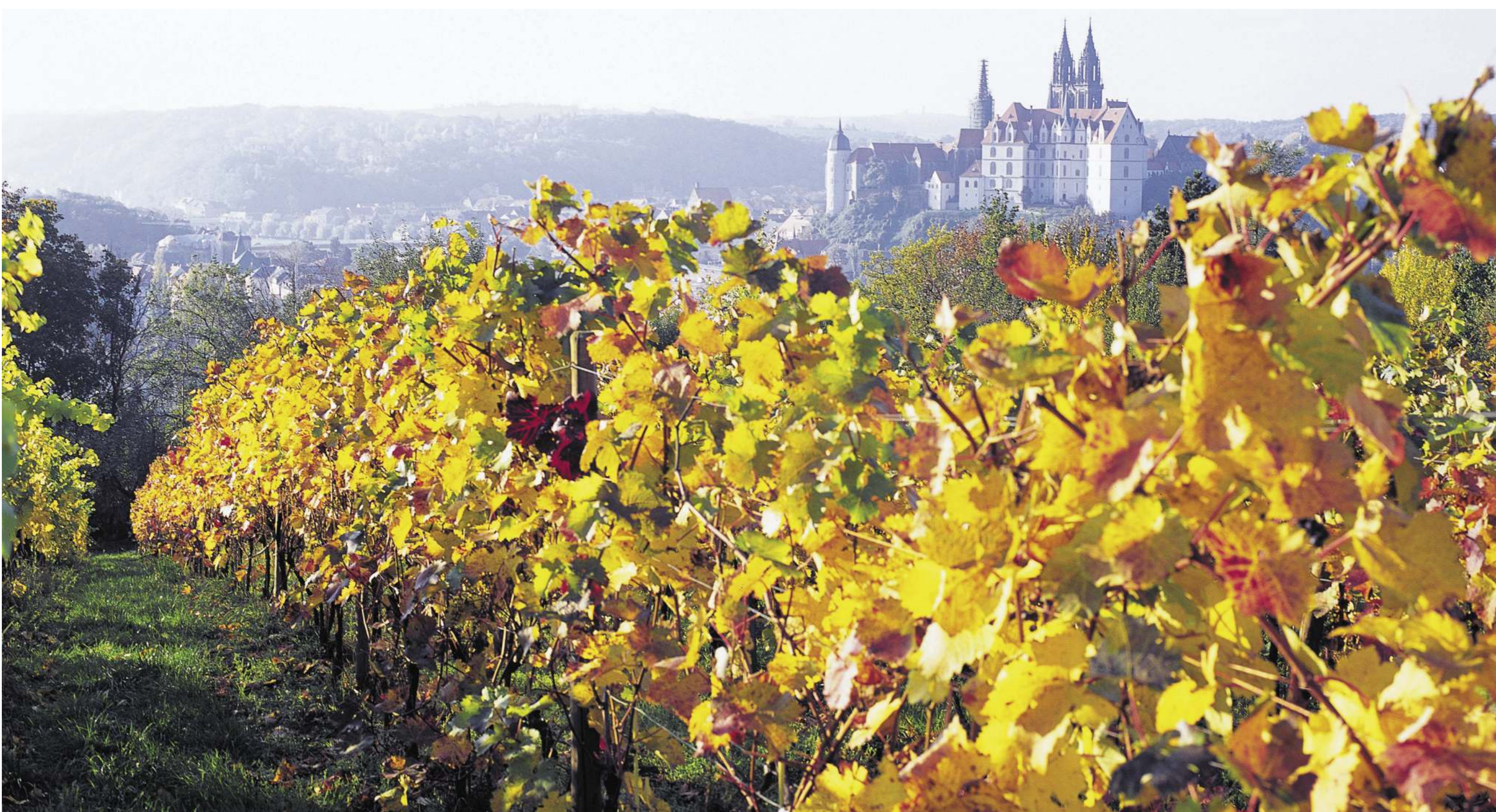
Blick von Proschwitz auf die Albrechtsburg Meißen.