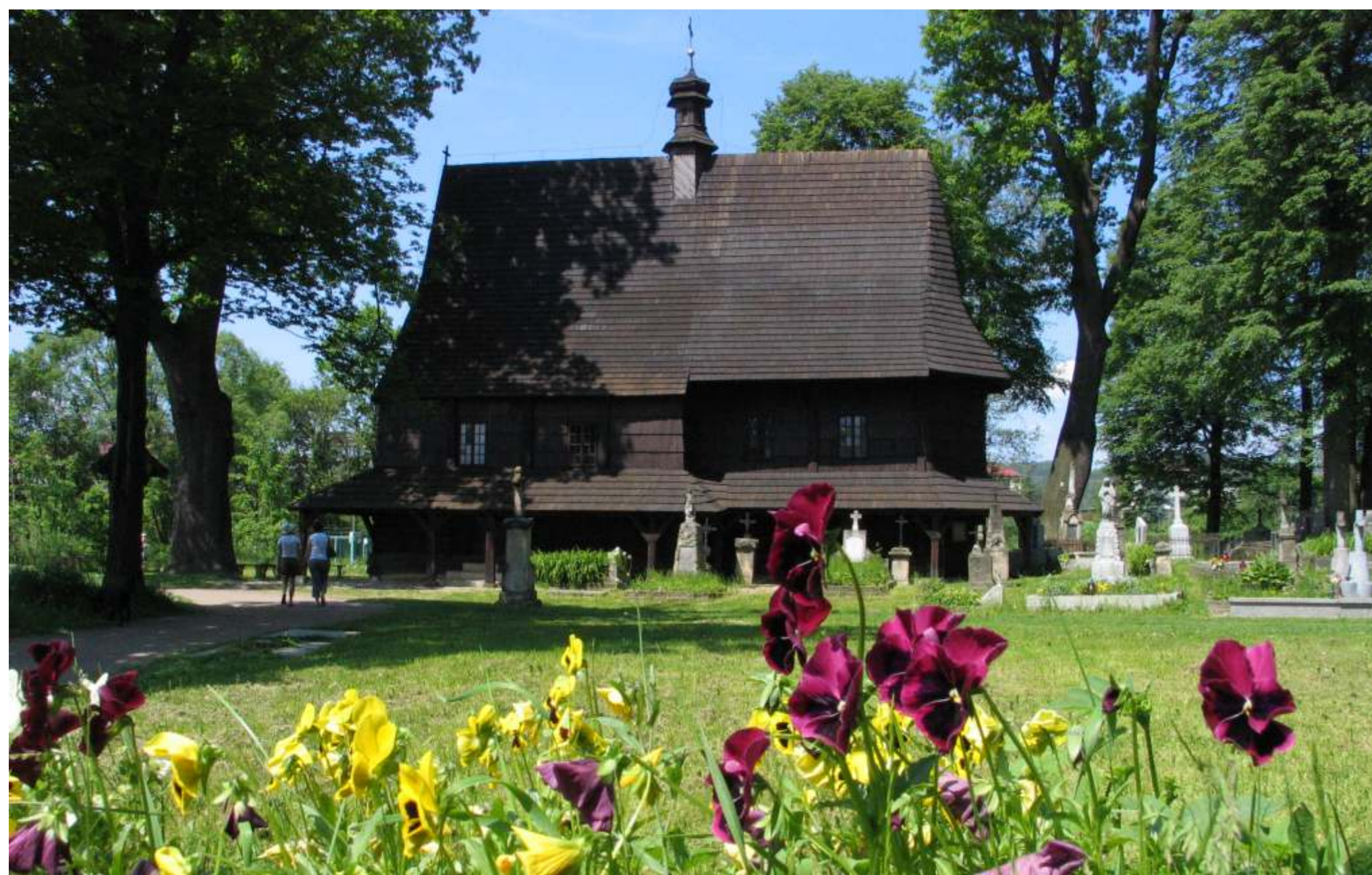
Lipnica Murowana.